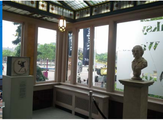
Vista de la Exposición de Banksy en el MOCO Museum