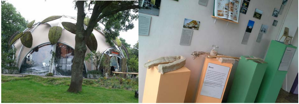
Imágenes de diferentes exposiciones y construcciones en el FabCity de Amsterdam.