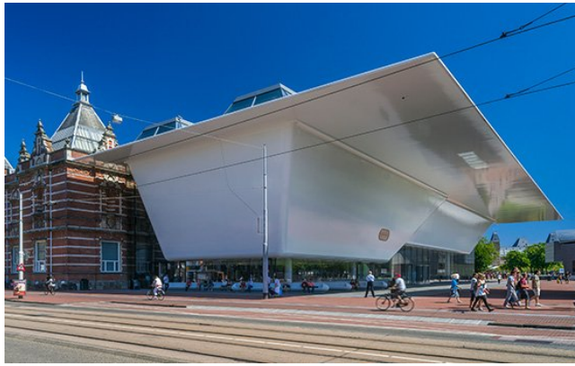
Stedelijk Museum de Amsterdam