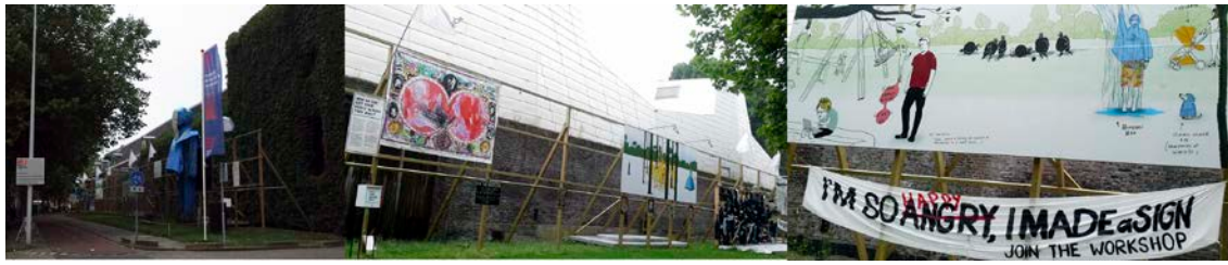
Imágenes de "The wall"