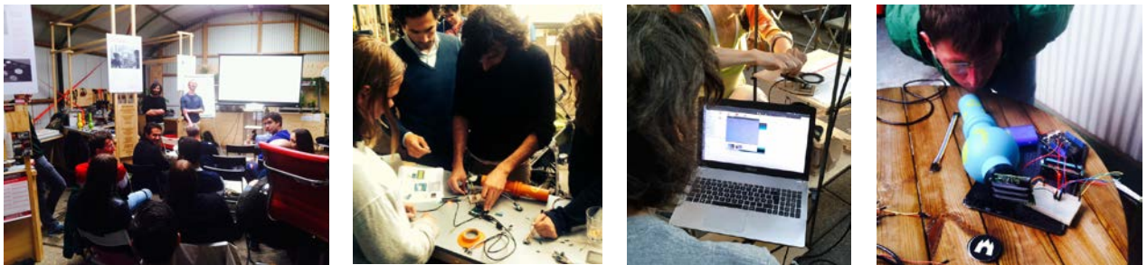
Imágenes de los talleres intensivos SMART CITIZENS, a los que tuve el placer de asistir los días 20, 21 y 22 de Julio en el FabCity (Para enseñar a los ciudadanos a medir la contaminación del agua, aire y ruido de su entorno, mediante software y hardware libre).