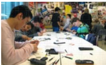
Waag Academy. Contact: Christine van den Horn

Today, kids are growing up in a society in which technology is becoming more important every day, but are still educated for the old world. With FabSchool, we are trying to find out how we can change this.