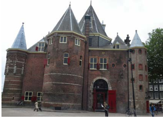
Sede de la Waag Society, en el Waag, una de las edificaciones históricas emblemáticas en el centro de Ámsterdam, Nieuwmarkt 4

Open Design Lab es posible gracias a una subvención del Fondo de la Liga Nacional Holandesa para la Creación Industrial.