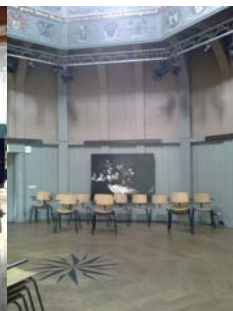
Imágenes de las instalaciones pertenecientes al Fab Lab de la Waag Society.