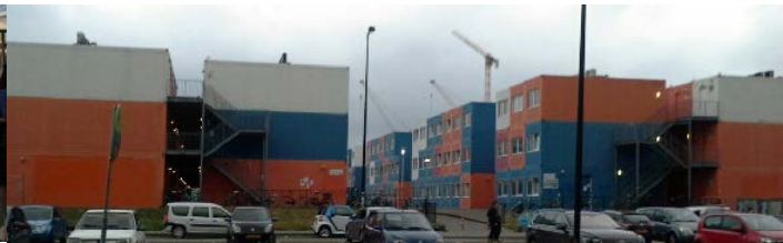
Vista del barrio de containers del NDSM http://www.ndsmloods.nl/