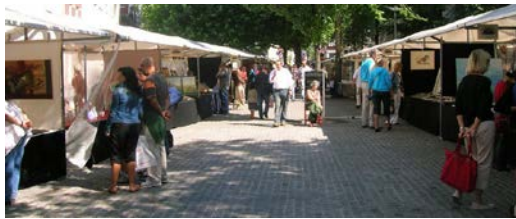
Vista del mercadillo de los museos